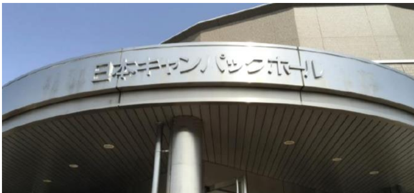
▼日本キャンパックホール入口看板