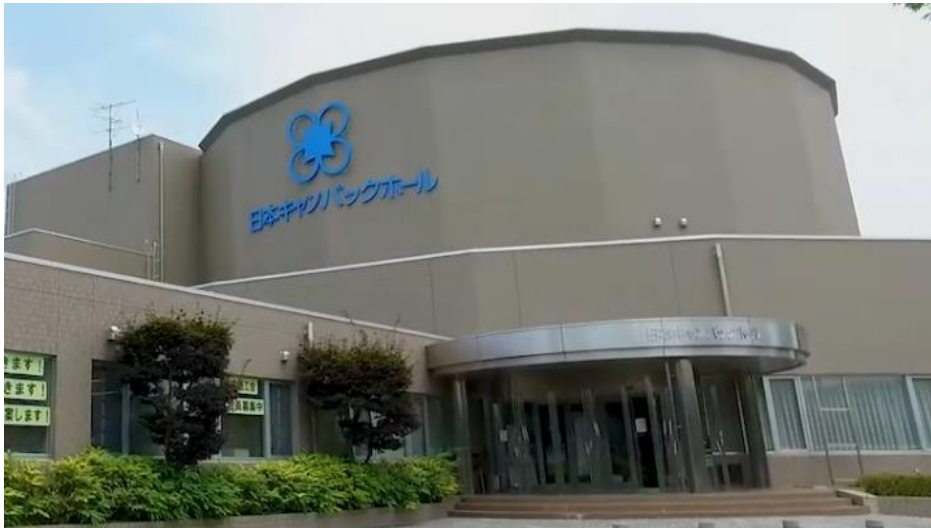
▼日本キャンパックホール外観